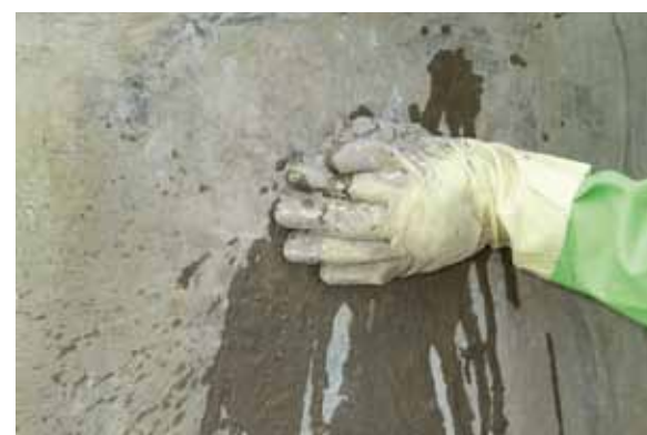
... in Sekunden...