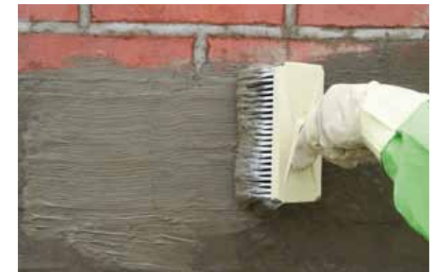
Direkt im Anschluss wird ein weiteres Mal die KÖSTER Kellerdicht 1 Schlämme aufgetragen. Dieser Schritt wird nach 30 Min. noch einmal wiederholt.

Zur Abdichtung feuchter Keller hat die KÖSTER BAUCHEMIE AG das KÖSTER Kellerdicht-Verfahren entwickelt, welches sich schon seit Jahrzehnten bewährt. Damit werden undichte Flächen und Einzelstellen, selbst wenn das Wasser fließt, schnell und einfach abgedichtet. Der Erfolg ist sofort sichtbar.