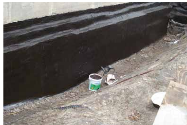
Das abgedichtete Mauerwerk