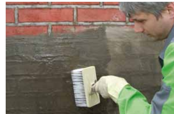
KÖSTER Kellerdicht 3 Härte-Flüssig wird ohne Wartezeit und mit einem sauberen Quast aufgestrichen.