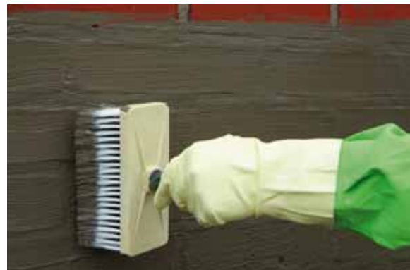
Die KÖSTER Kellerdicht 1 Schlämme wird mit einem Quast oder einer festen Bürste aufgetragen.

Zur Instandsetzung einer schadhafte Kelleraußenabdichtung ist es naheliegend, diese freizulegen und nachzubessern. Diese Art der Nachbesserung scheidet jedoch in vielen Fällen von vornherein aus, weil ein Aufgraben entweder zu teuer oder zu aufwändig ist. Sei es, dass bei Teilunterkellerungen ein Zugang zu den überbauten Außenwänden unmöglich ist oder dass Überbauten wie Garagen, Auffahrten oder Straßen bestehen. Eine einfach durchzuführende und kostengünstige Alternative ist die Abdichtung von innen (Negativabdichtung).