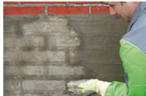
Das KÖSTER Kellerdicht 2 Blitzpulver wird per Hand in die frische, nasse Schlämme eingerieben, bis die Fläche trocken ist.